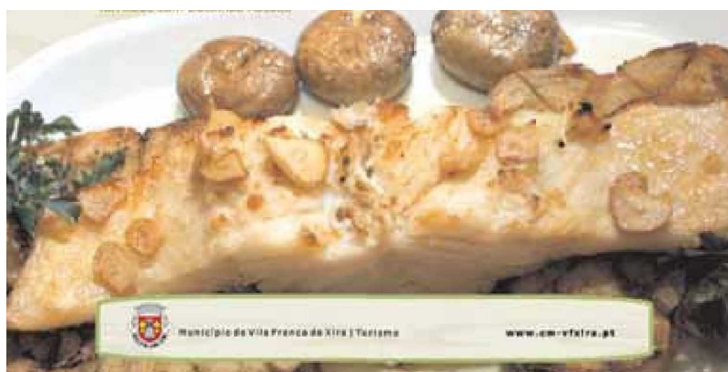
Fugas • Sábado 15 Novembro 2008 • 27