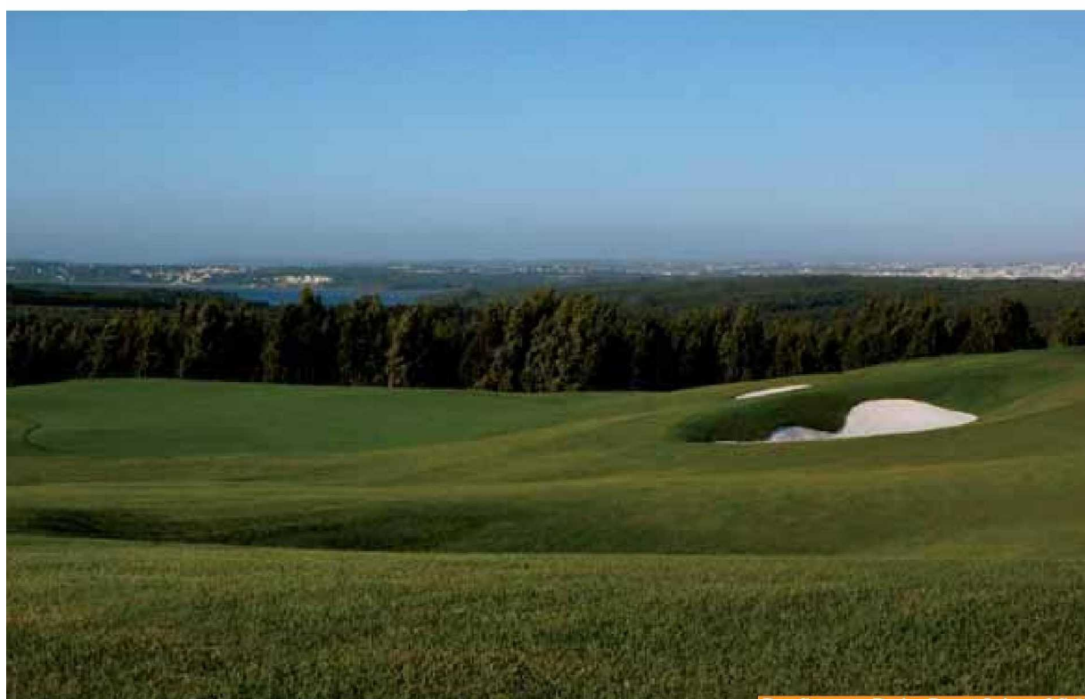
Um campo de golfe perto de Lagos, Portugal