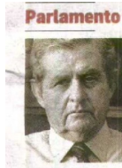
Lobo Antunes arrasa projecto do PS de testa- mento vital POLÍTICA PÁG. 10