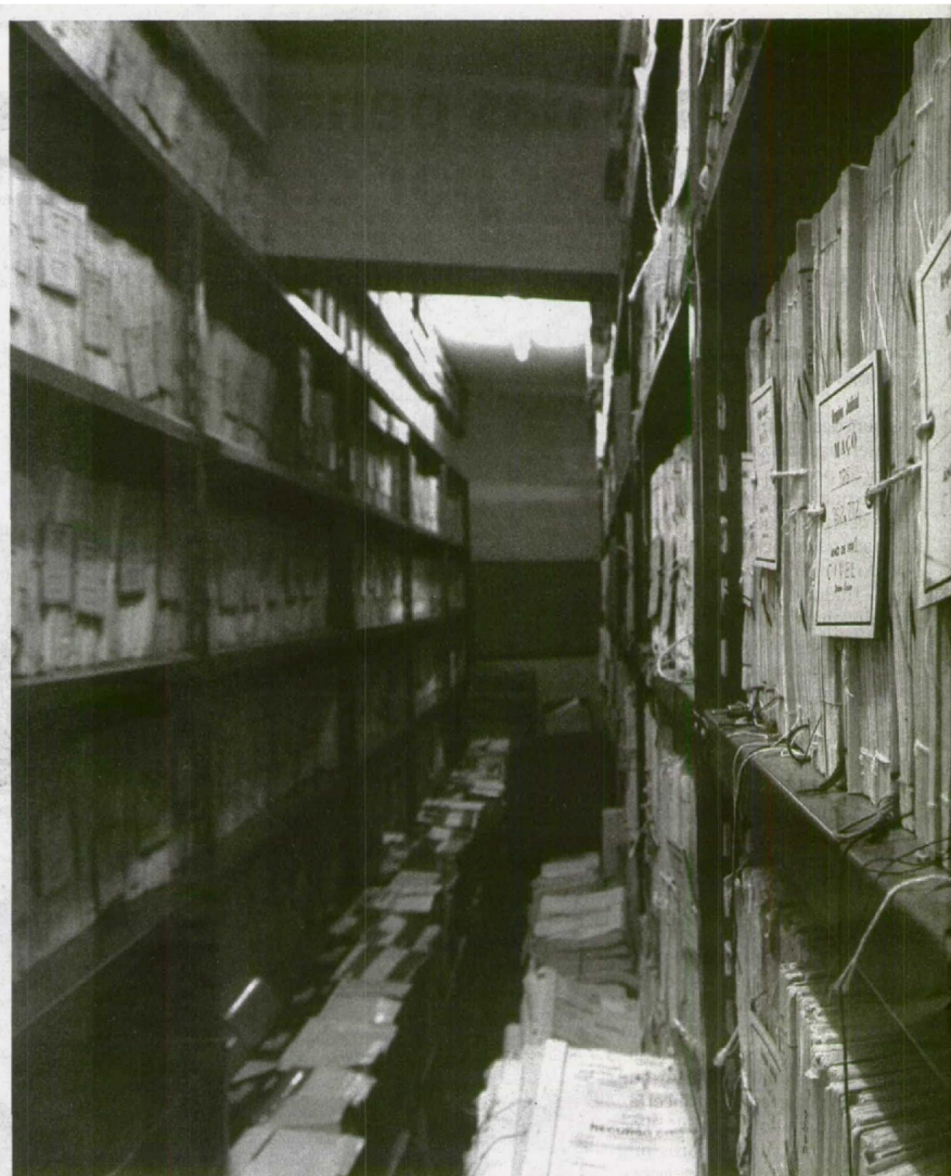
Celeridade | É uma das palavras-chave das propostas de alteração à Lei das insolvências ontem apresentadas pelo Ministério da

Mesmo nos casos em que a opção não seja o PEC, os devedores poderão tomar eles próprios a iniciativa de juntar os credores e tentar chegar a um acordo de pagamento. Havendo acordo, não seria necessária a intervenção do tribunal. Não havendo, mas estando reunida uma percentagem significativa de credores, superior a 50%, então o acordo poderá depois ser homologado por um juiz e tornar-se vinculativo para todos os credores. O envolvimento judicial servirá de garante de que estão salvaguardados os vários interesses envolvidos. Trata-se, conclui Paula Teixeira da Cruz, de um "mecanismo fundamental numa estratégia de recuperação e viabilização de empresas em dificuldade económica".