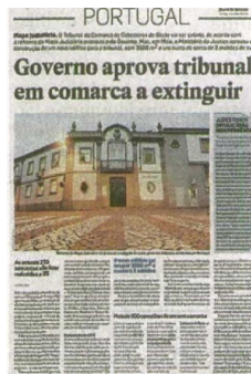
O DN tinha avisado há 4 anos