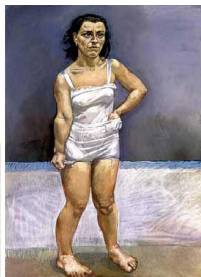
Sem Título (A Cinta), 1995