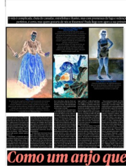
Como um anjo que