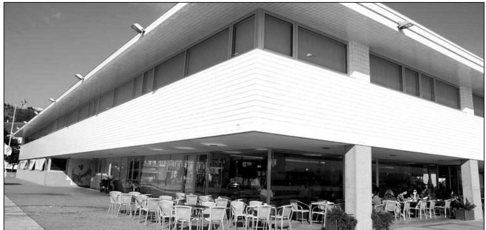
Empresa está a fazer a mudança do arquivo do tribunal