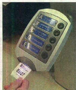
Um novo sistema de senhas