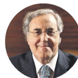
REIS CAMPOS Construção

"A CTP lamenta que o documento não integre projetos estruturais para o desenvolvimento da economia do turismo. O PRR é omissivo e não reflete a importância da atividade para o PIB e para a criação de riqueza e emprego"