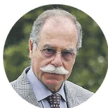
OLIVEIRA E SOUSA Agricultura

"Vai ser preciso modernizar a economia, garantir emprego, investir em apoios diretos, promover fusões, trabalhar em rede. No PRR tudo isto é subvalorizado em detrimento das necessidades do Estado. Faz-nos pensar que vem aí mais do mesmo"