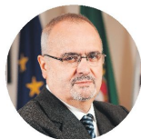
VIEIRA LOPES Comércio

"A pandemia vai fazer-nos perder 10% do PIB. Só no final de 2023, iremos voltar aos valores de 2019. Não podemos continuar com crescimentos anémicos, esmagados por falta de reformas e um Estado que absorve 55% da riqueza"