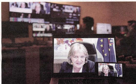
Elisa Ferreira alerta para a necessidade de apostar em vários setores económicos